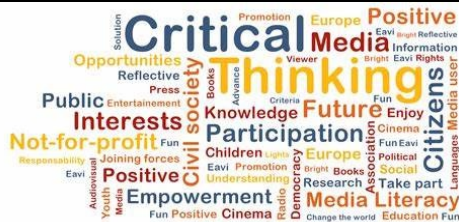
Imaginea 2. Educația mediatică.