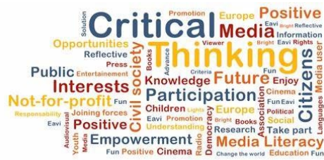
Kuva 2. Medialukutaito.